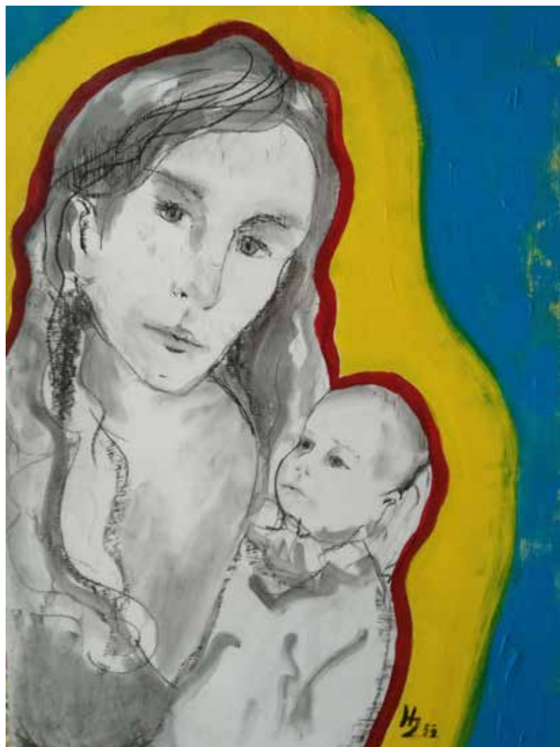
Láska je naděje (Ukrajina 2022), sololit, uhel, akryl 70 × 55 cm, 2022