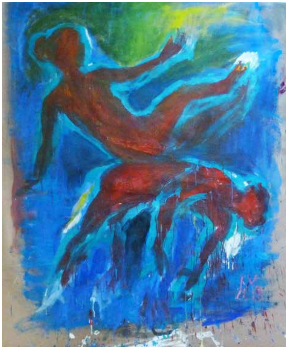
Naděje, akryl, folie, 180 × 140 cm, 2019