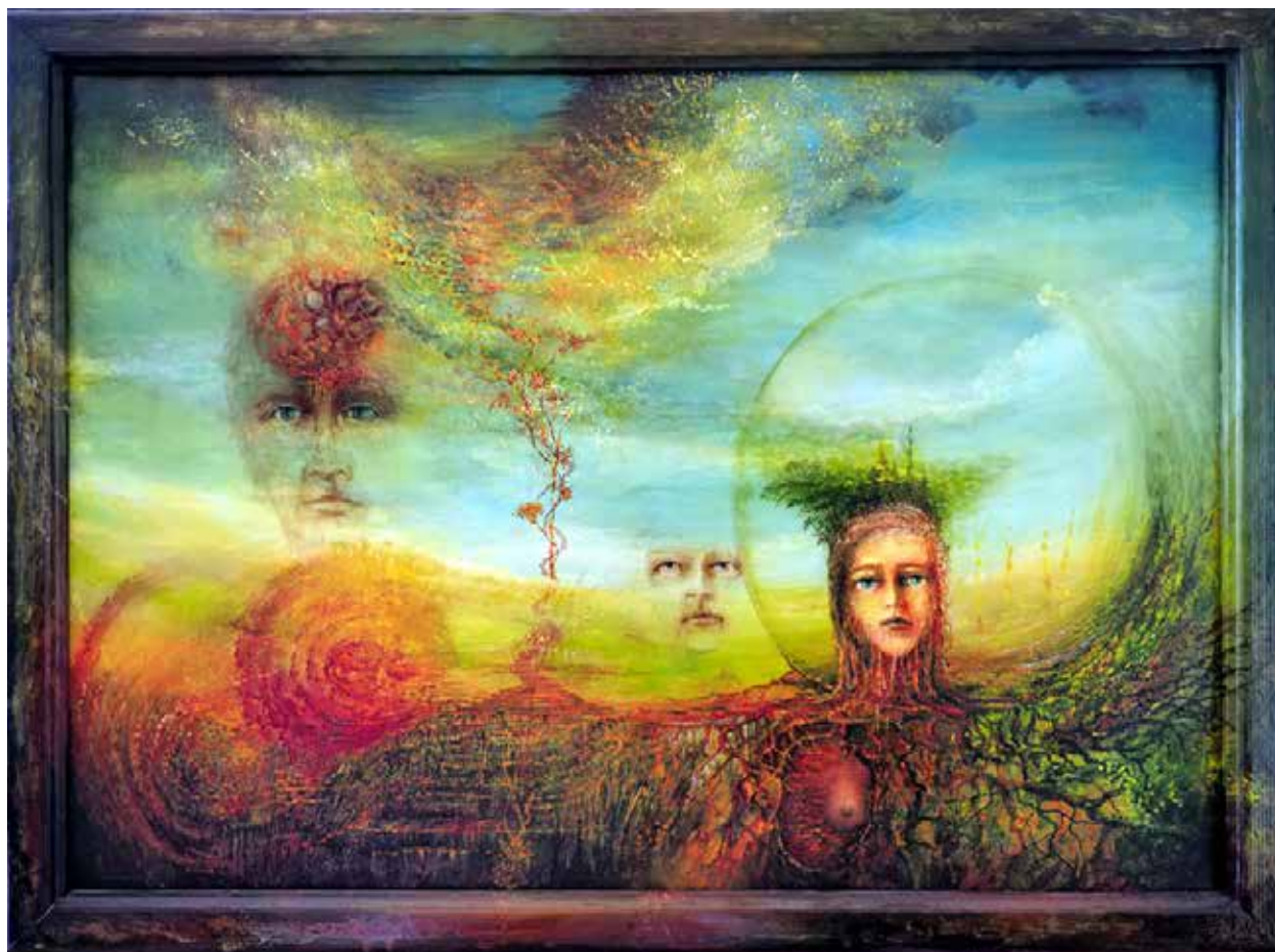
Sen o cestě životem, olej na plátně, 50 × 70 cm, 2021