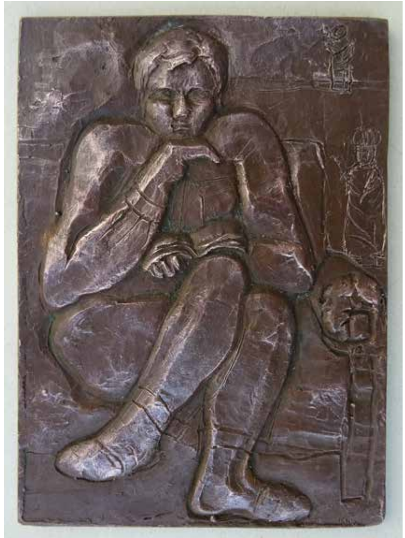
Zdeněk, reliéf, bronz, 14 × 10 cm, 2002