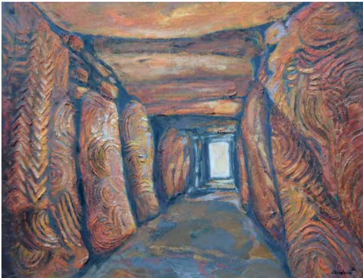
Poselství, kombinovaná technika na plátně, 60 x 80 cm, 2022