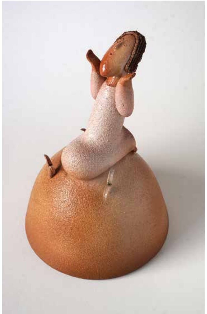
Na hoře Olivetské, keramika, pórovina, barevné glazury, v 28 cm, 2021