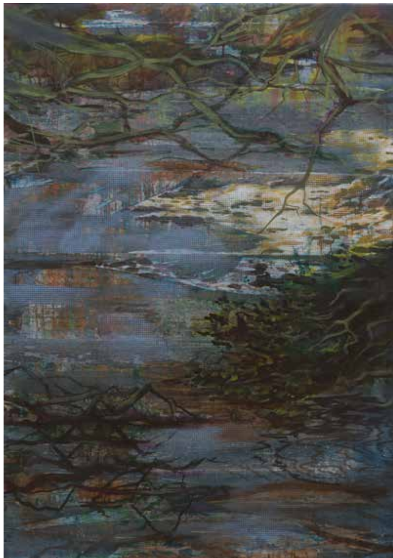
Meandr, kombinovaná technika, 140 × 100 cm, 2020