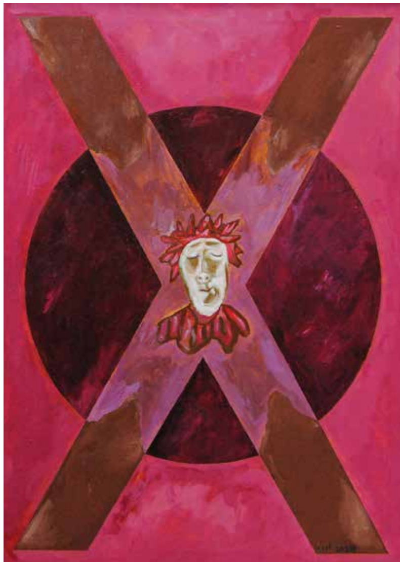
Desatero přikázání, olej na plátně, 70 × 50 cm, 2020