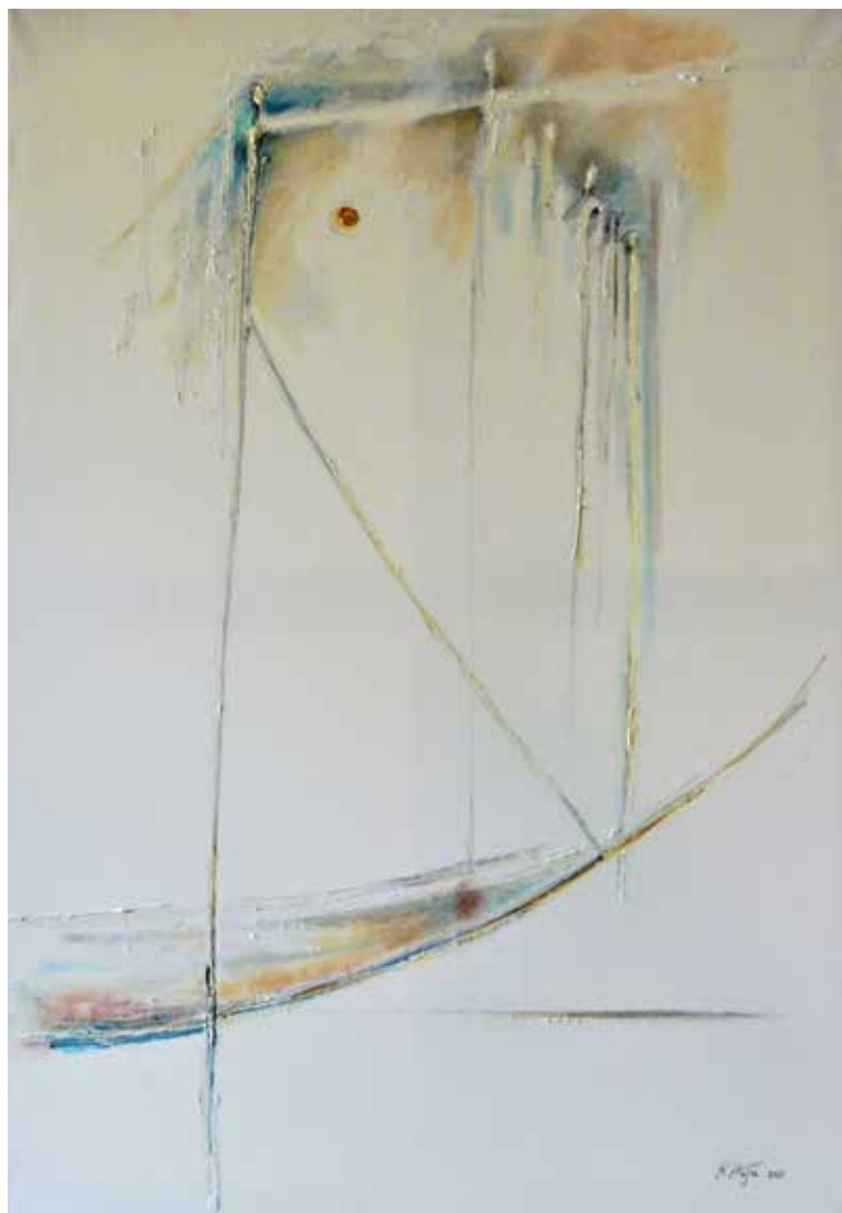
Spojení, olejomalba na plátně, 100 × 70 cm, 2021