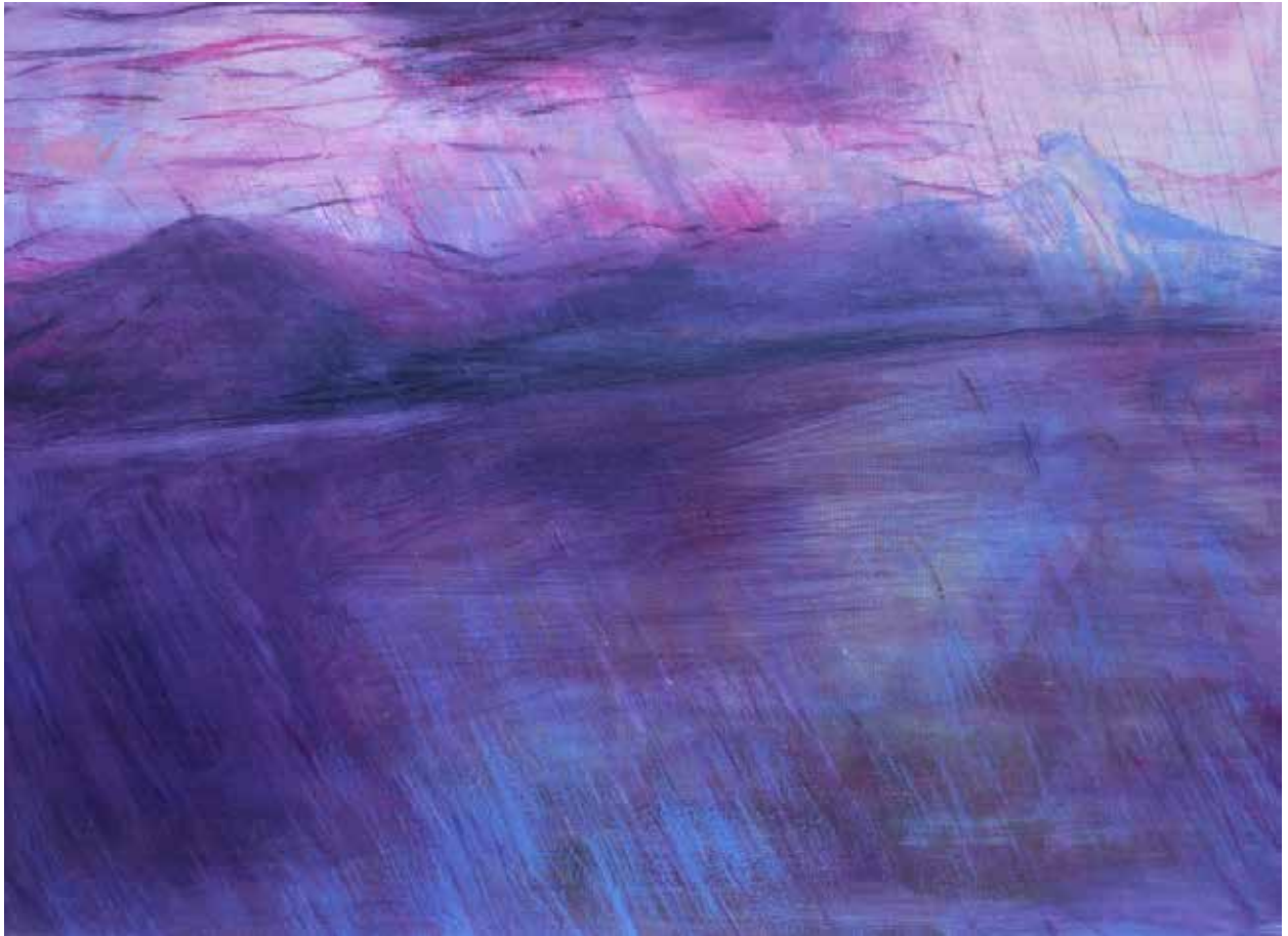
Prazemě, olej na plátně, 50 × 70 cm, 2021