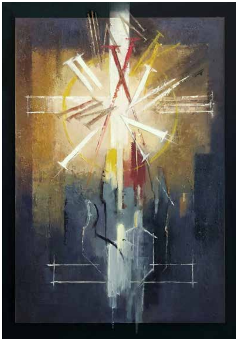
Desatero / Nový zákon, akryl, 75 × 50 cm, 2019