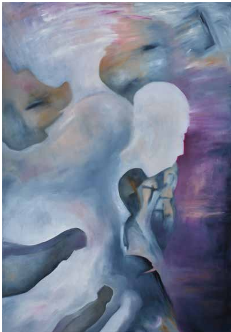
Staré jako lidstvo samo, olej, 100 × 70 cm, 2022