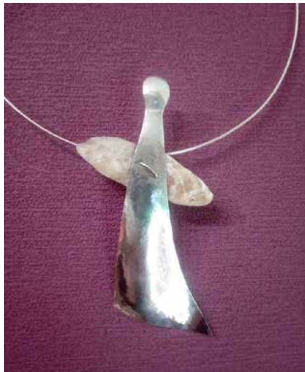
Andělé, šperk, stříbro, mušle, 2021