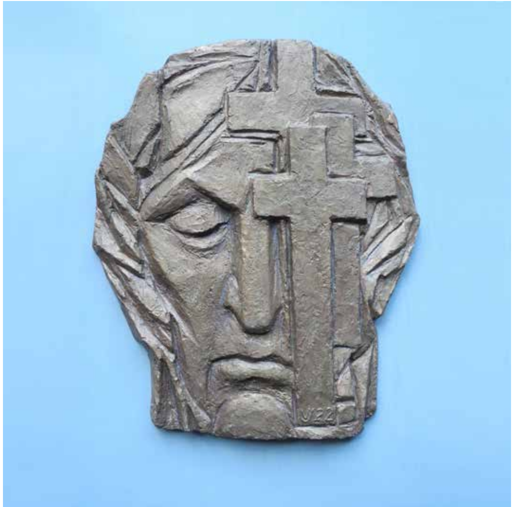
Pokání, pálená hlína, 40 x 25 cm, nedatováno