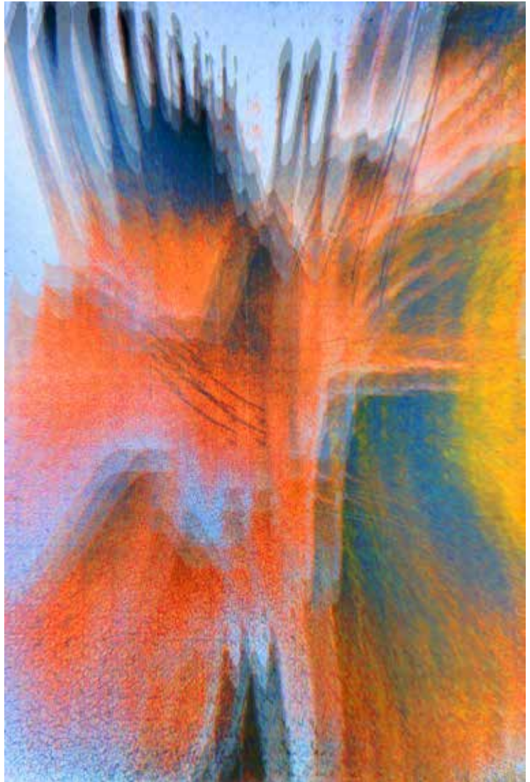
Naděje, kombinovaná technika, 15 × 10 cm, 2016