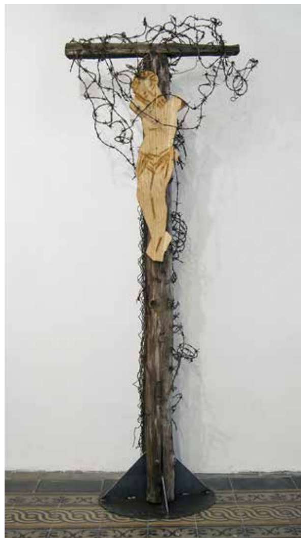
Fragment železné opony ze Šumavy (tzv. EZOH – Elektrické zabezpečení ochrany hranic) a tělo Krista (dřevo), výška 200 cm, 2022