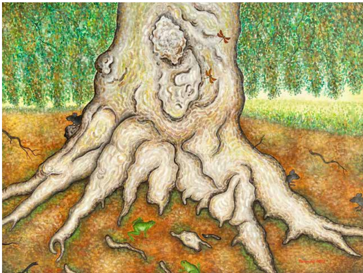
Starý strom, olej na plátně, 90 × 130 cm, 2022