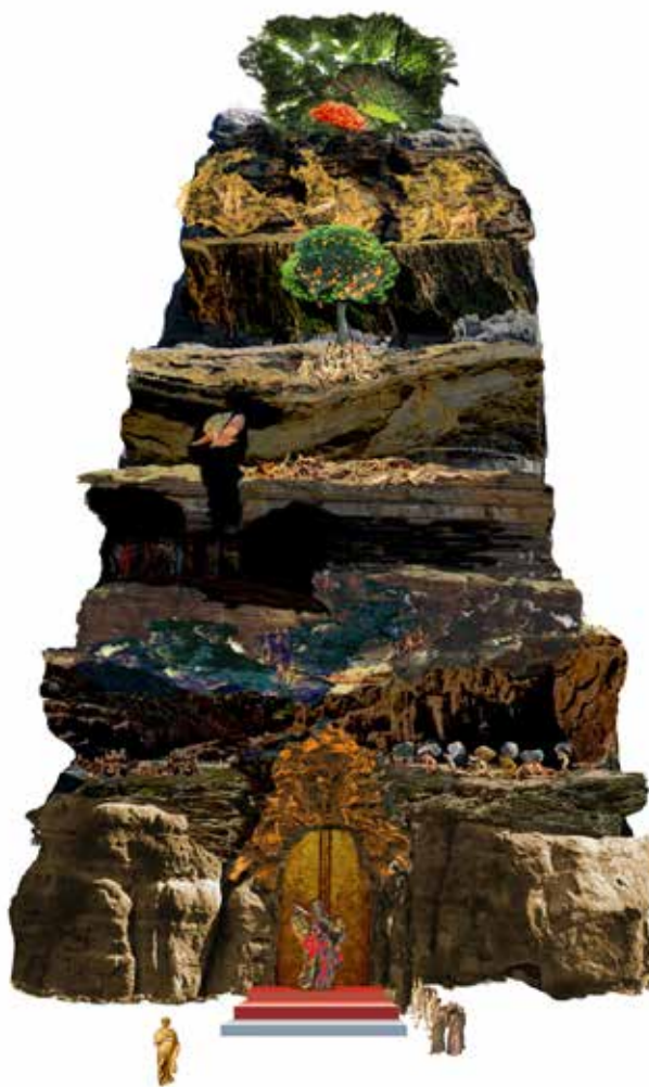
Hommage a Danre – očistec, počítačová grafika, 100 × 70 cm, 2014