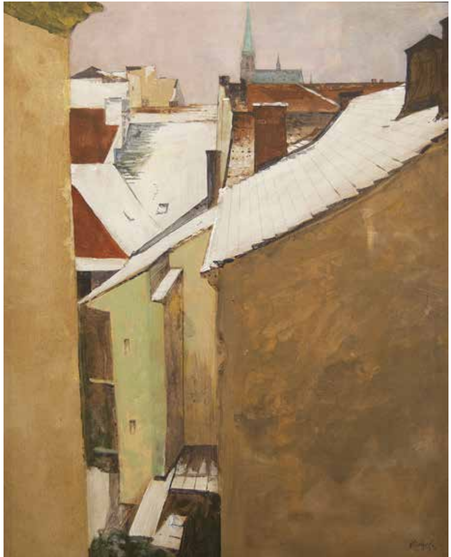
Střechy, akryl na plátně, 62 × 50 cm, 2021