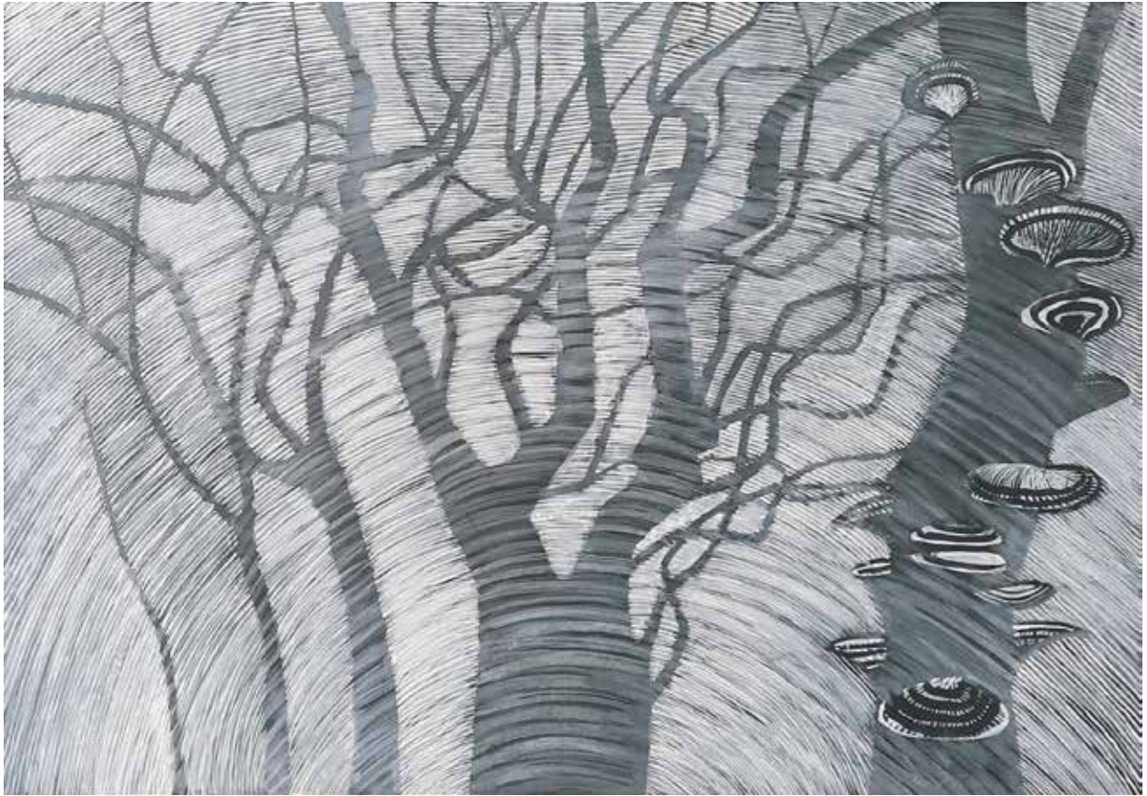
Mládí, zralost, stáří, kresba, 70 × 100 cm, 2007