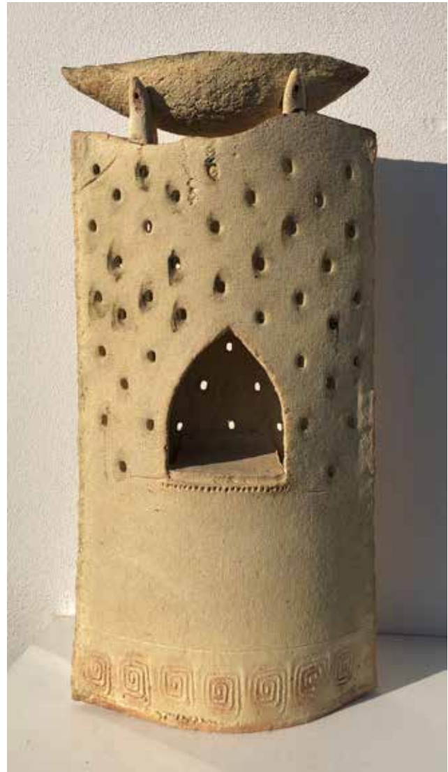
Světlo Naděje, šamot, kysličníky kovů, v 45 cm, 2022