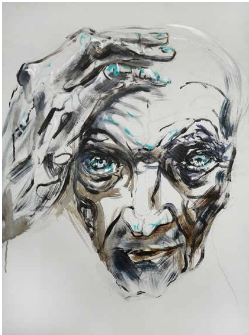
Odevzdání se, akryl, 100 × 70 cm, 2020