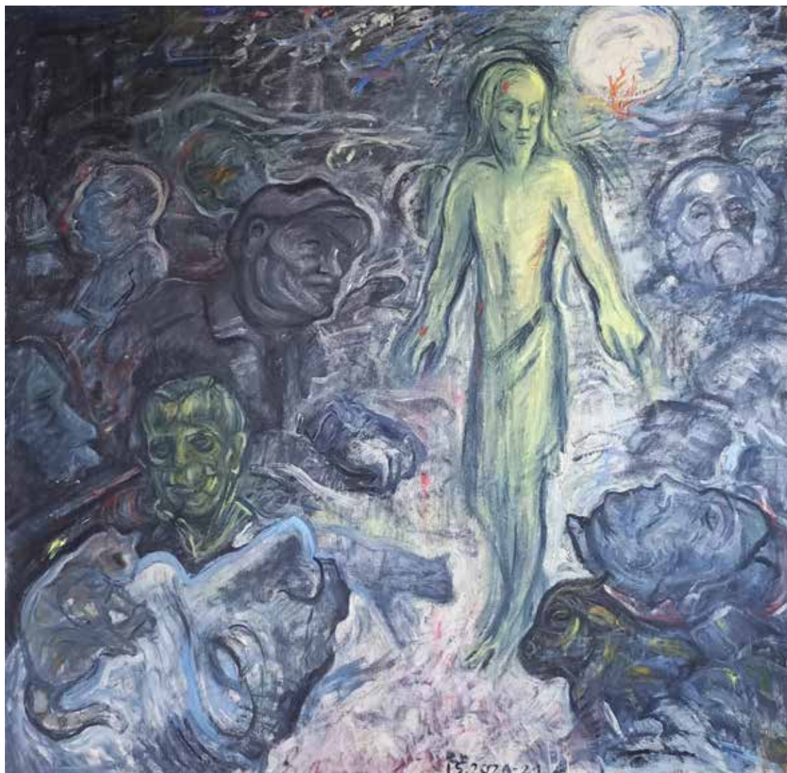
Nepostavíš modly sobě, olej na plátně, 115 × 115 cm, 2021